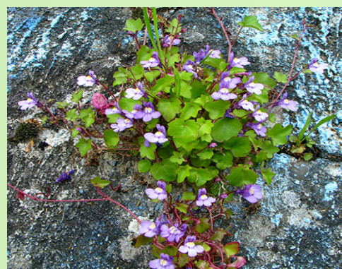
Cymbalaire des murailles